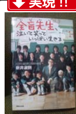
長瀬中で「復帰」したこの先生の歩みは本にもなり感動を呼んだ