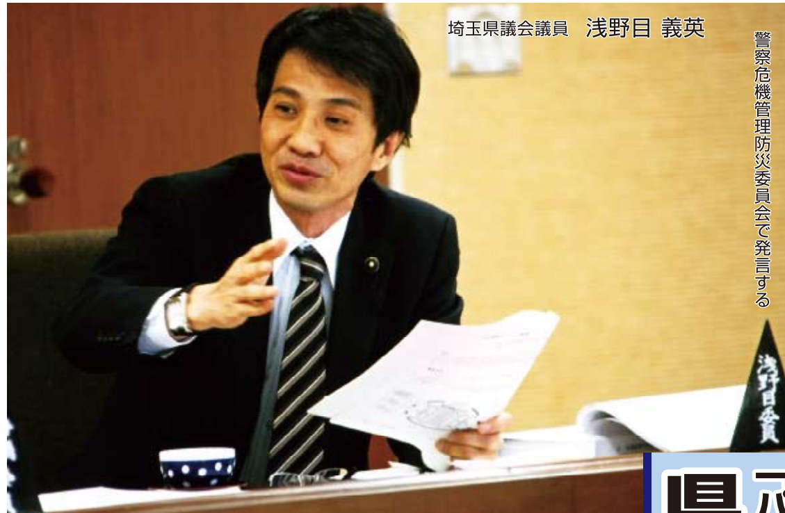
埼玉県議会議員 浅野目 義英