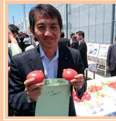
埼玉農業に力を (県農業技術研究センター)