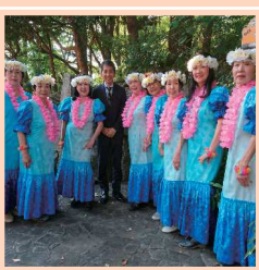
浦和区民まつり (調公園)