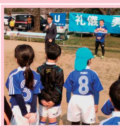
浦和ラグビースクールに 伺う(大原グラウンド)