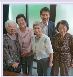
長寿を祝う会 (岸町コミセン)