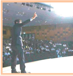
第13回・「あさのめ県政報告会」(埼玉会館)