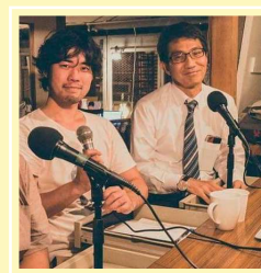
ラジオで県政を語る (radio与野)