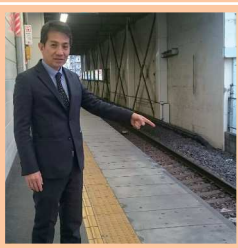
全盲男性転落死事故 現場調査(蕨駅)