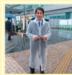
第48回総選挙 (浦和駅西口)