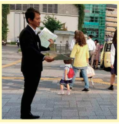
駅頭街宣で県政報告を 配布(浦和駅東口)