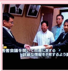
代表者会議を開くことを 求める(議長室)