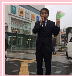
駅頭で遊説活動 (浦和駅東口)