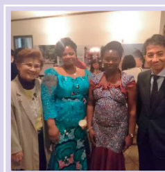
トゴ共和国大使夫人 らと(トゴ大使館)