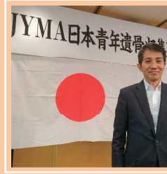
外地に眠る戦没者の 遺骨を早く日本へ