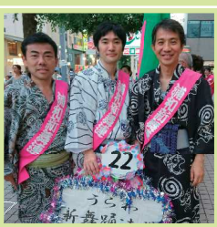
浦和おどりに参加 (中山道)