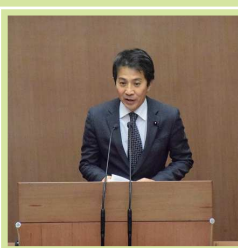
代表質問で県政の課題 解決を訴える(県議会)