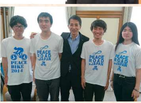
北は北海道宗谷岬から南は沖縄までを、自転車に またがりリレー形式で縦走しながら、平和を訴える 青年たち。埼玉県庁に参訪されました。