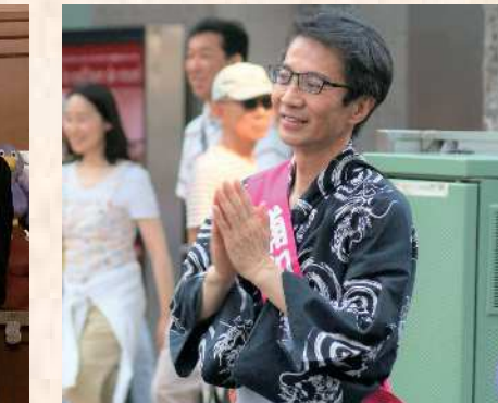
今年も、うらわおどりに参加しました。