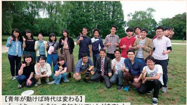
【青年が動けば時代は変わる】 バーベキュー大会に、参加させていただきました。 一段落して、青年部のみなさんと写真撮影。