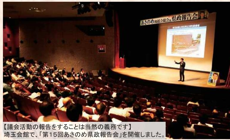
【議会活動の報告をすることは当然の義務です】 埼玉会館で、「第15回あさのめ県政報告会」を開催しました。