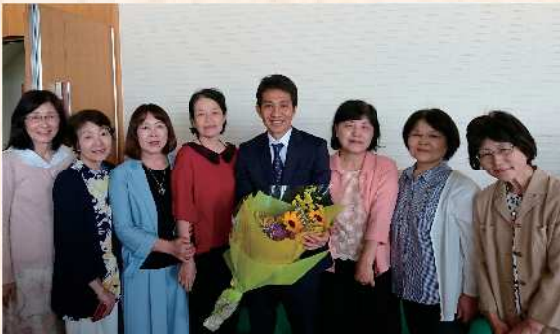
お世話になっている団体の集会で花束を頂戴する。