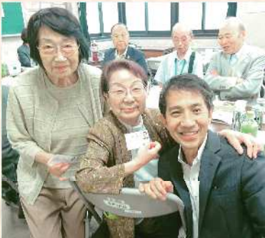
敬老の日に。健康長寿！幸福長寿！