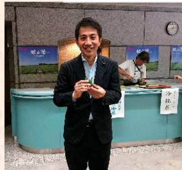
狭山茶の試飲会に参加しました。 県でも二番茶を活用した抹茶の研究を 始めているようです。