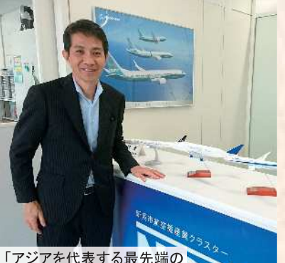
「アジアを代表する最先端の 航空機エンジン事業の拠点」が巨大な スケールで、埼玉県に整備されます。 先立ち、新潟市航空産業立地推進室を 調査しました。