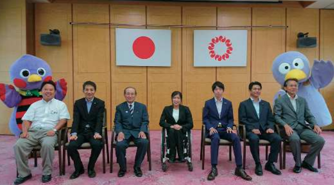
【5か月も経ちやっとなさ 世界の二人に彩の国功労賞】 設楽悠太選手(マラソン男子日本記録保持者)、 村岡桃佳選手(平昌冬季五輪で5個のメダル獲得)に、 県議会各党派代表でお祝いをしました。