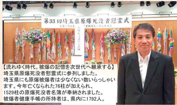
【流れゆく時代。被爆の記憶を次世代へ継承する】 埼玉県原爆死没者慰霊式に参列しました。 埼玉県にも原爆被爆者は少なくない数にのぼります。 今年亡くなられた76柱が加えられ、 1529柱の原爆死没者名簿が奉納されました。 被爆者健康手帳の所持者は、県内に1792人。