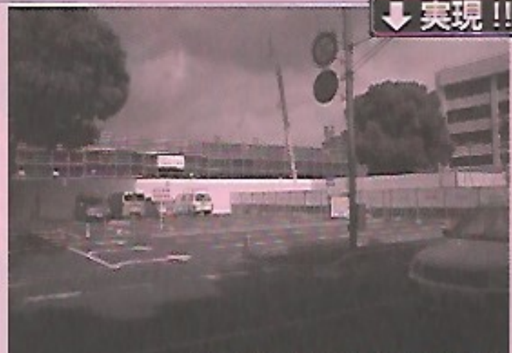
防災センター 平成23年3月、浦和区に完成する。

県防災センター建設へ 県庁舎は地震対策を強化。災害発生時に迅速な対応を行う上で課題がある状況だ。