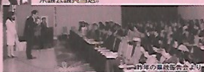
昨年の県政報告会より