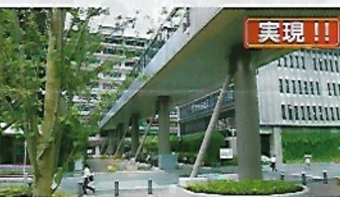
▲急ぎ補強された。この突っ張り棒は方杖(ほうづえ)という。