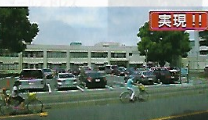
▲埼玉県危機管理防災センター。運用開始日平成23年3月11日!