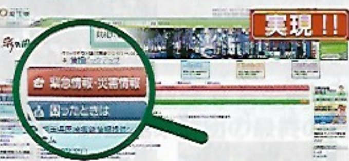
▲パナール開設後約324万アクセス！大変役立っている。

【知事答弁】 県庁舎は極めて脆弱との認識がある。災害対策本部を置く施設の可能性を考えていく。