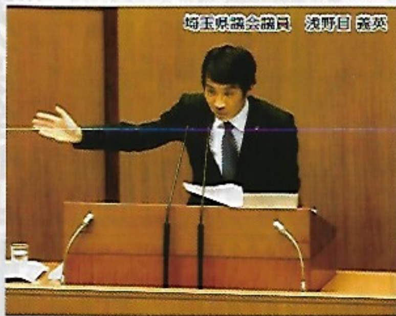
埼玉県議会議員 浅野目 義英