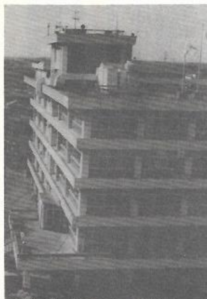
▲昨年中は、揺れ動いた上尾市役所