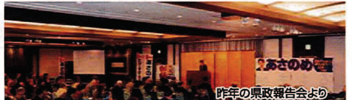
昨年の県政報告会より