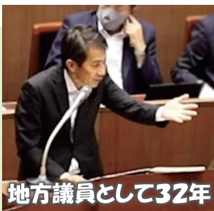
地方議員として32年