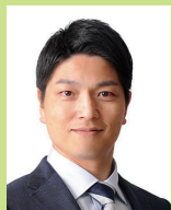
北岡くじゅう (浦和区)