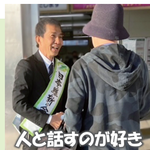
人と話すのが好き